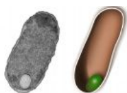
Bakterienzelle mit Designer-Organellen – solche synthetische Hohlgebilde könnten sich als Reaktionsräume für biotechnologische Prozesse eignen.

Auf die Idee, eine Zelle mit künstlichen Reaktionsräumen, sogenannten „Designer-Organellen“, auszustatten, kam Schiller in Freiburg. An der Albert-Ludwigs-Universität hat er hier seit 2008 eine eigene Forschergruppe am Freiburg Institute for Advanced Studies (FRIAS) aufgebaut, die an biohybriden Nanomaterialien forscht. Als Bausteine für die künstlichen Bläschen verwendet das Team neuartige Proteinmoleküle. Deren molekularer Bauplan wird in die Labormikrobe E. coli eingeschleust. „Unsere Bakterienzellen produzieren amphiphile Proteinmoleküle, die sich in der Zelle spontan zu Hohlstrukturen zusammenlagern“, erläutert der Forscher. Die Bläschen sind ihren natürlichen Vorbildern, den Vesikeln, recht ähnlich.